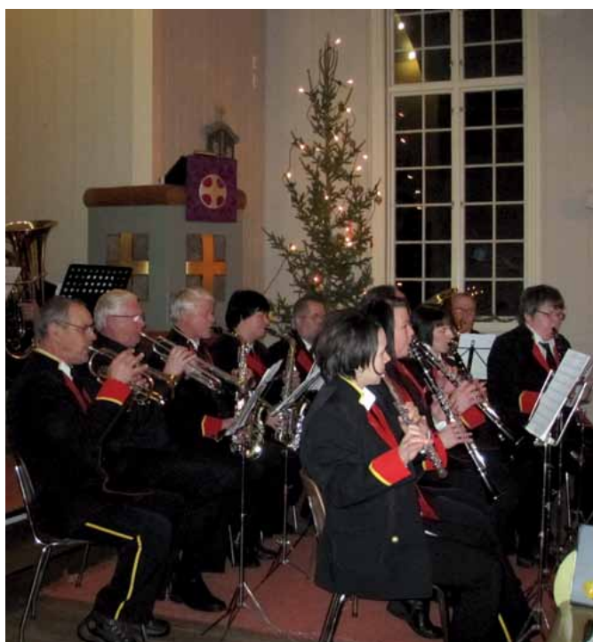
"Vi synger julen inn" Ballangen kirke søndag 12. desember.