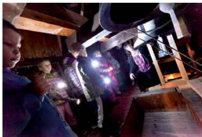
”Tårnagentene” i kirketårnet.