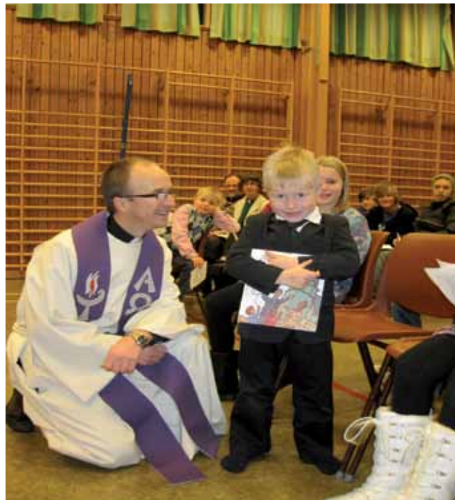
Utdeling av 4-årsboka på Bøstrand 5. desember 2010.