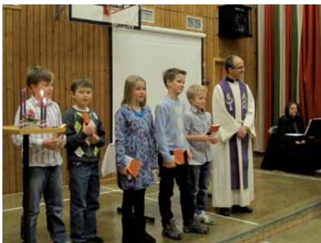
Utdeling av Nytestamenter på Bøstrand til 5.- klassinger samme dag.