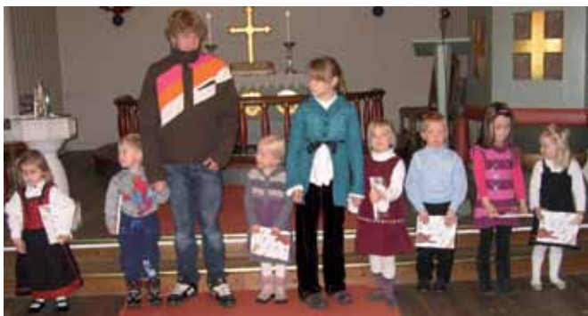
4-åringer som fikk utdelt 4-årsboka i Ballangen kirke søndag 24.oktober 2010.