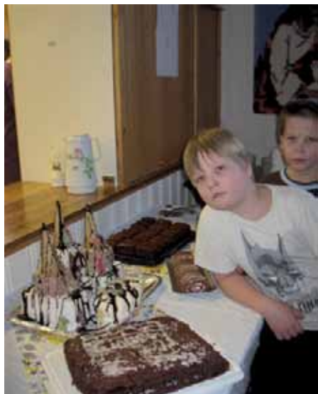
Tårnkake og annet godt til kirkekaffen.