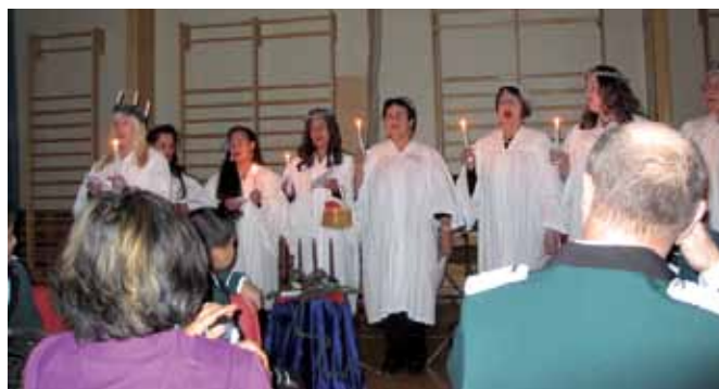
"Stjerner i mørketid", Kjeldebotn 11. desember.