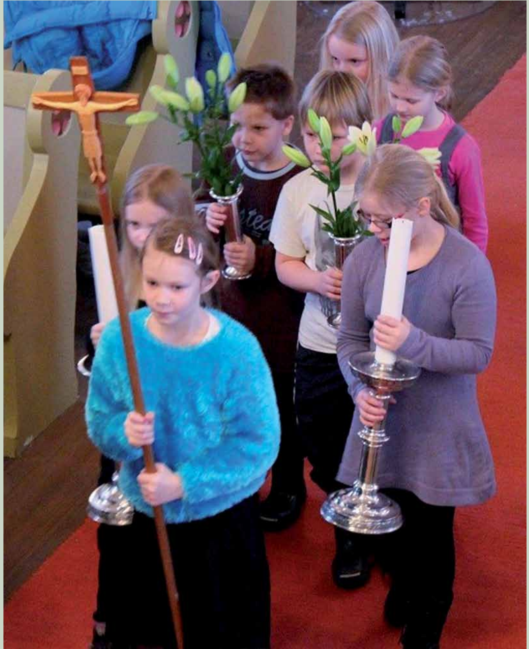
"Sprell levende" gudstjeneste