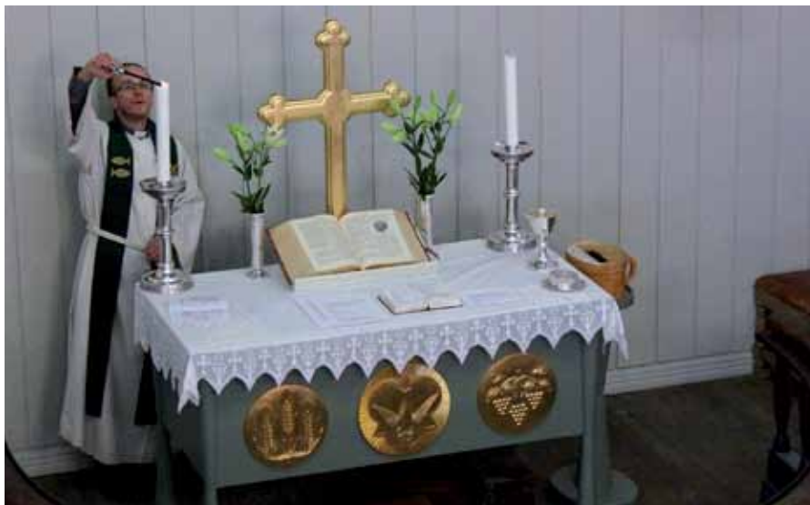
Sognepresten: Tenner lys og ønsker velkommen til en "Sprell levende" gudstjeneste.