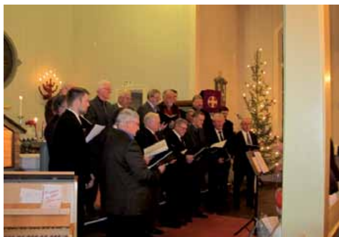
Også mannskorset synger julen inn i Ballangen kirke søndag 12. desember.