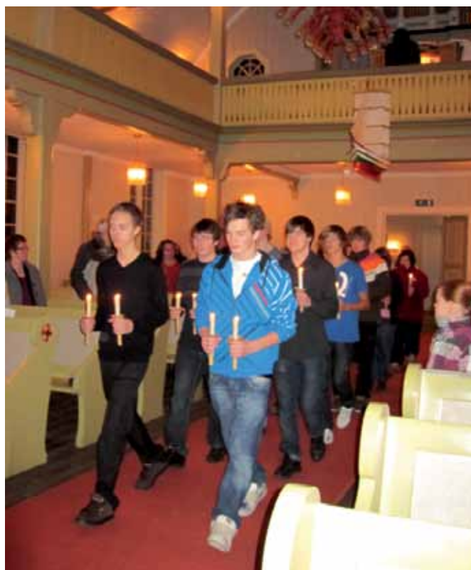
Lysmesse i Ballangen kirke søndag 5. desember.