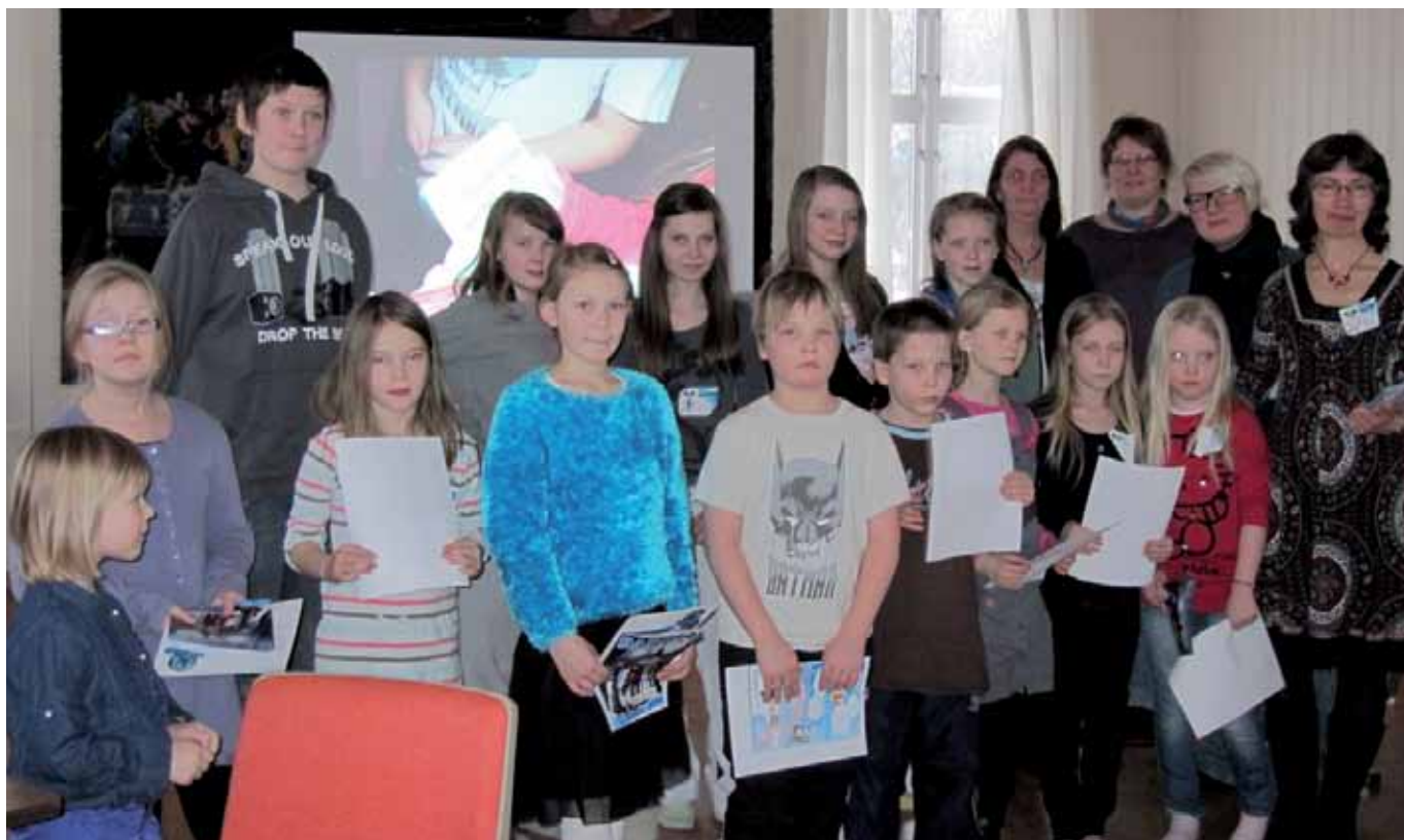
Her er alle tårnagentene samlet og alle voksne som var med.